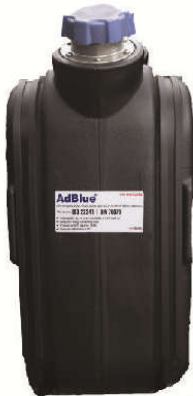
Bình 50L tiêu chuẩn